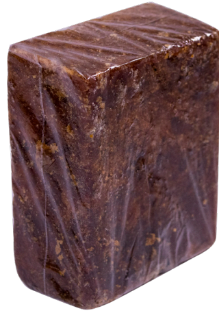
PANELA EN BLOQUE